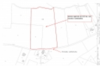
Mappa terreno con confini