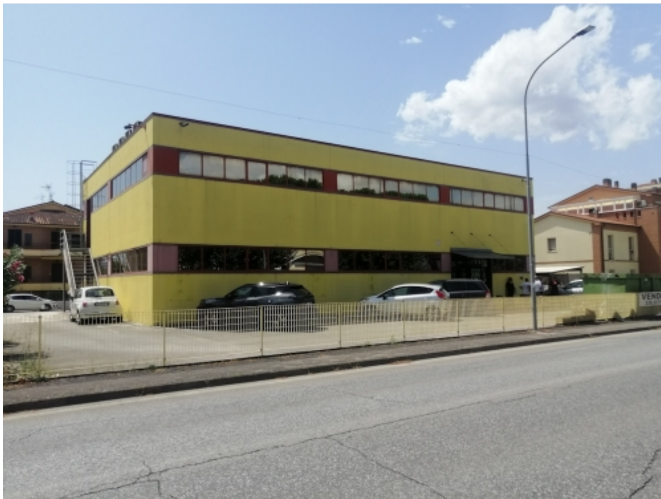
Capannone lato fronte