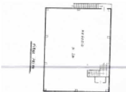
Planimetria catastale 1° piano