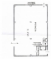
Planimetria catastale piano terra