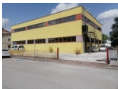
Capannone lato retro