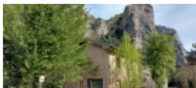
casa in pietra

Categoria: Case nei Borghi e Castelli - Immobiliare Jesi