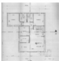
Planimetria piano primo

In una localita' incantevole nel cuore delle Marche , lungo la strada consolare antica Roma - la Flaminia, alla Gola del il Furlo , casa in pietra su due livelli piu' soffitta con terrazza panoramica , struttura in bellissima pietra del luogo gia' completata allo stato grezzo . Al piano terra oltre ad un comodo garage vi e' spazio sufficiente per un appartamento con 2 camere e doppi servizi . Al piano primo a cui si puo' accede anche direttamente , previsto un appartamento di quasi 150 mq con 3 camere e doppi servizi