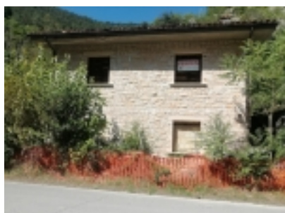
casa in pietra