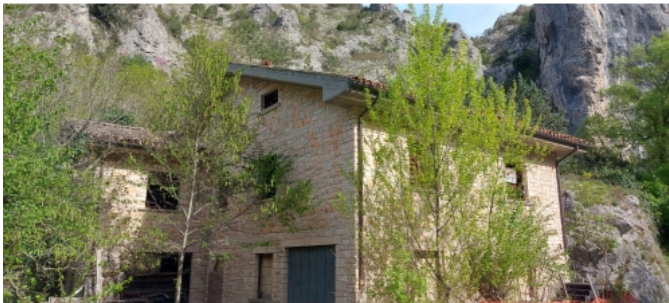
casa in pietra