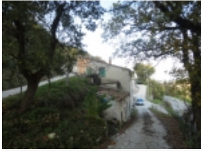
casa in pietra