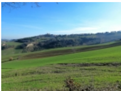
vista villa e terreno

Categoria: Case e Ville Ristrutturate - Immobiliare Jesi