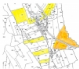
Terreni zona Moricozzi