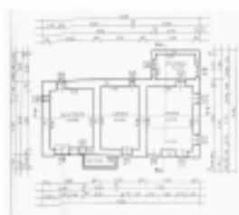
Planimetria piano terra