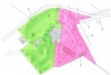
Mappa colorata corte