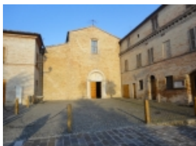
Abbazia San Firmano