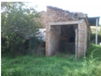
Antico forno a legna