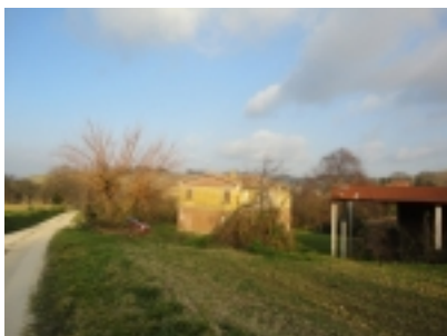
casa con corte