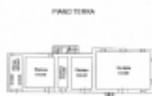
Planimetria catastale piano terra