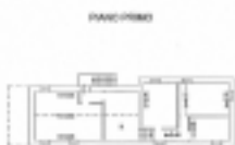
Planimetria catastale piano primo

Note: Vi e' la possibilita' di acquisire terreno agricolo attiguo di 4,4 ha. dello stesso proprietario .